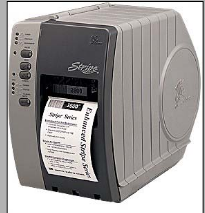
Abb.: Stripe S-600 Art.-Nr.:250A21021050

Die Drucker der Stripe-Serie ermöglichen es Ihnen, äußerst kostengünstig beim Etikettendruck auf die bewährte Zebraqualität zurückzugreifen.