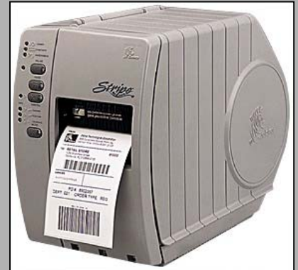
Abb.: Stripe S-400 Art.-Nr.: 250A21021000

Die Drucker der Stripe-Serie ermöglichen es Ihnen, äußerst kostengünstig beim Etikettendruck auf die bewährte Zebraqualität zurückzugreifen.